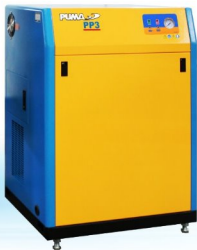
PP3 / PP3T